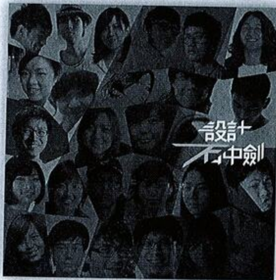
2011 第一屆設計石中劍圓桌武士

想把你的創意商品化、並與國際知名品牌合作嗎？ 想獲得人生第一筆簽約金、看到你的設計上市銷售嗎？ 帶著你滿腦的創意力、過人的行動力及忘我的投入度， 加入設計石中劍計畫，讓你夢想成真！！