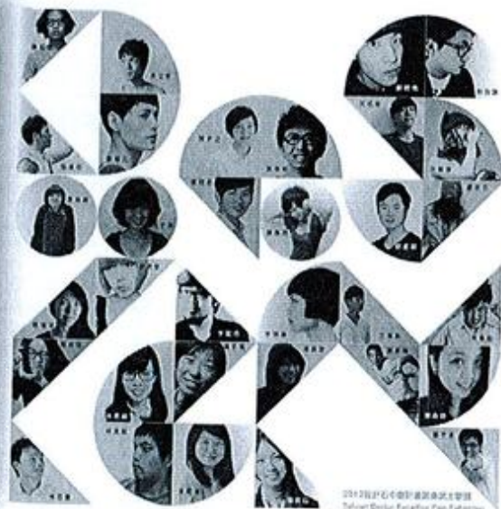
2012 第二屆設計石中劍圓桌武士